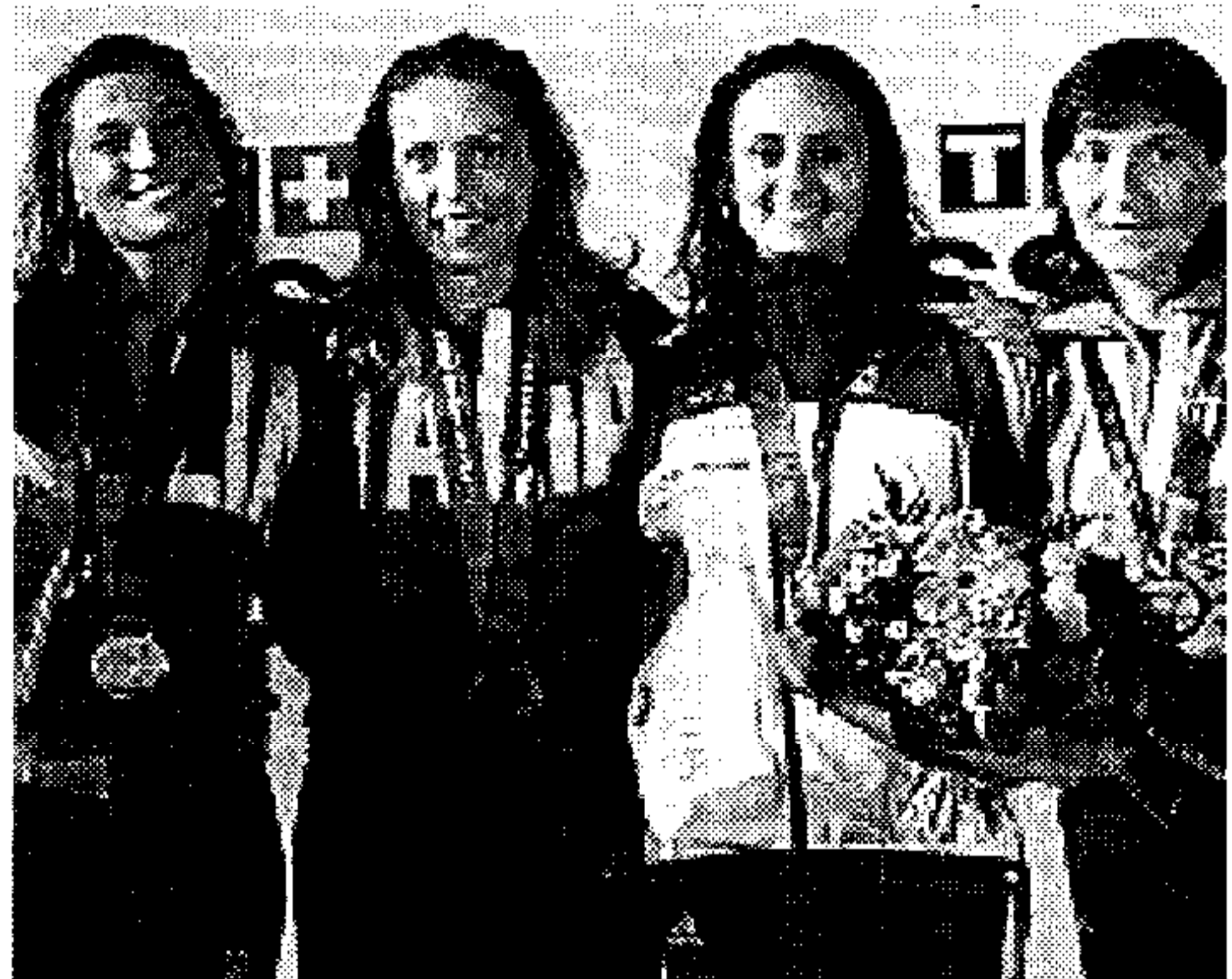
Le azzurre sul podio con la Mohammed (4 a )

spot mondiale dell'Italia che si allena, suda in palestra, non guadagna grandi cifre, ma che vince e non manca mai i grandi appuntamenti.