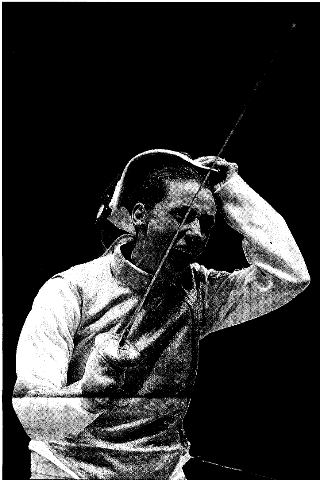
Valentina Vezzali ha compiuto ieri 34 anni e a Pechino affronterà la sua quarta Olimpiade

«Ho vissuto tante crisi, con la paura di non poter completare la missione ricevuta»